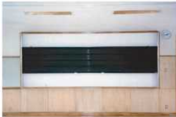
木枠 上下黑板（五線入） 一枚図